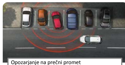
Opozarjanje na prečni promet