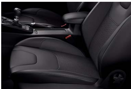
Usnjene sedežne prevleke

Premium sredinska konzola s Powershift menjalnikom →