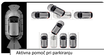
Aktivna pomoč pri parkiranju