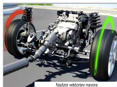
Nadzor vektorjev navora