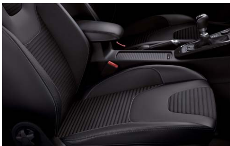
Delno usnjene sedežne prevleke