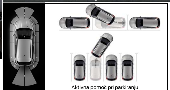
Aktivna pomoč pri parkiranju