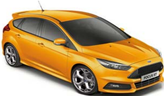
ST-2 / ST-3