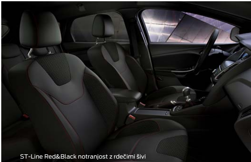
ST-Line Red&Black notranjost z rdečimi šivi