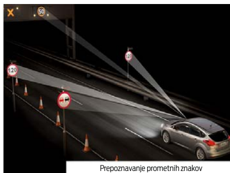
Prepoznavanje prometnih znakov