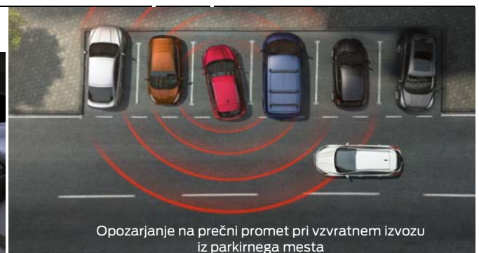
Opozarjanje na prečni promet pri vzratnem izvozu iz parkirnega mesta