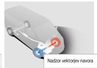
Nadzor vektorjev navora