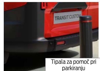
Tipala za pomoč pri parkiranju