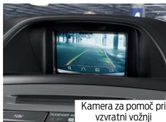
Kamera za pomoč pri vzratni vožnji