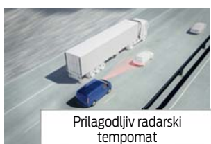
Prilagodljiv radarski tempomat