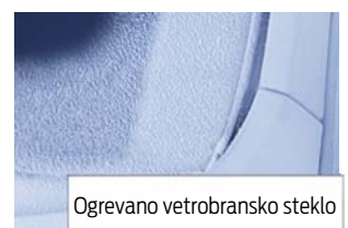
Ogrevano vetrobransko steklo