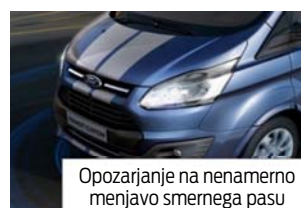
Opozarjanje na nenamerno menjavo smernega pasu