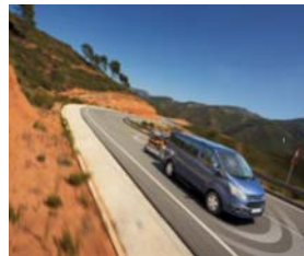
Vlečna kljuka (s programom za stabilizacijo priklopnika TSC)