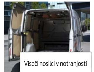
Visoči nosilci v notranjosti