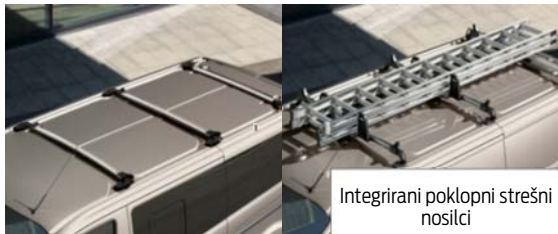
Integrirani poklopni strešni nosilci