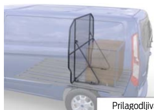
Prilagodljiva mrežasta pregradna stena

Opomba: Ni na voljo s setom za zaščito tovornega prostora (EOC 462)