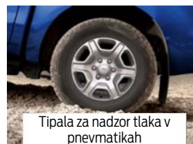
Tipala za nadzor tlaka v pnevmatikah