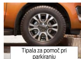
Tipala za pomoč pri parkiranju