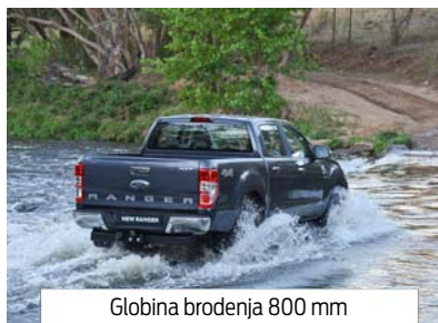
Globina brodenja 800 mm