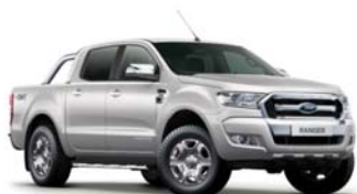
Moon dust Silver